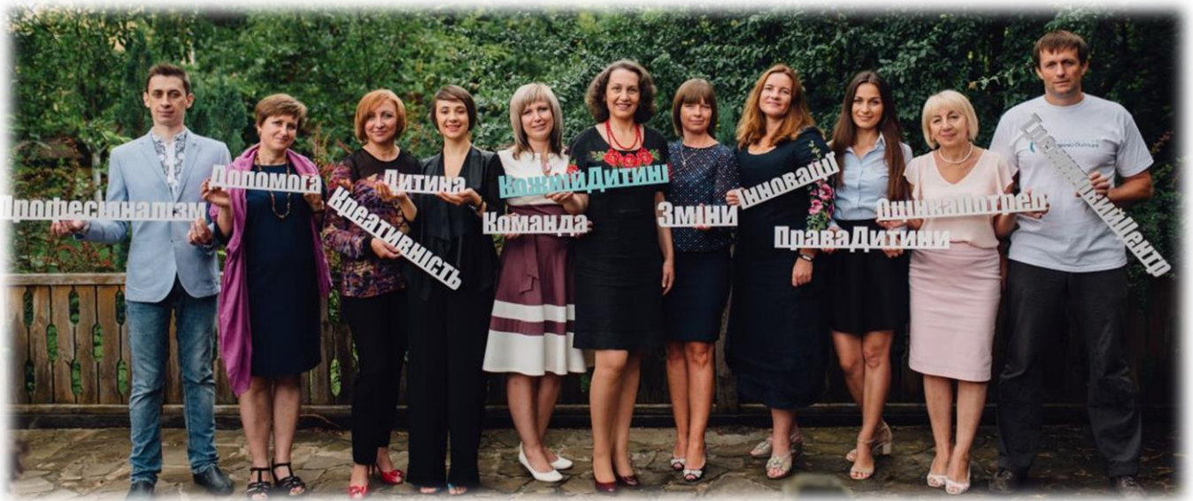
Команда Партнерства «Кожній дитині»