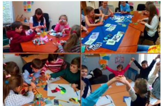
Розвивальні заняття із внутрішньо переміщеними дітьми