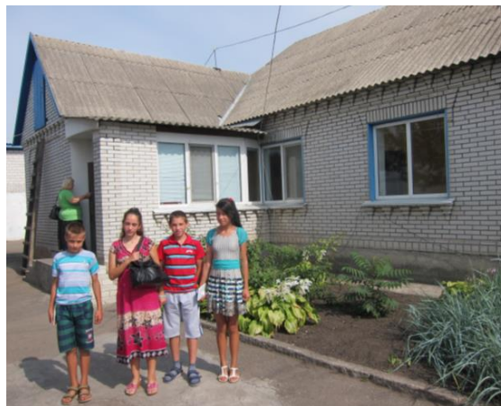
Внутрішньо переміщена сім'я біля свого нового будинку

Проект виконувався у тісній співпраці зі Службою у справах дітей та сім'ї Київської обласної державної адміністрації (провідний координатор).