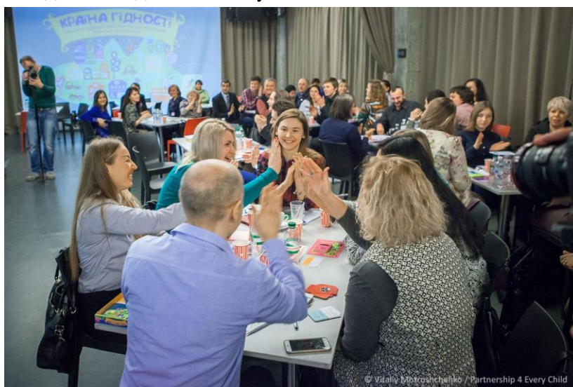
Презентація навчальної гри «Країна Гідності», 3 березня 2016р.