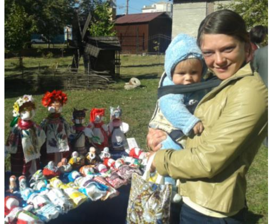
Учасниця проекту відвідує місцевий ярмарок