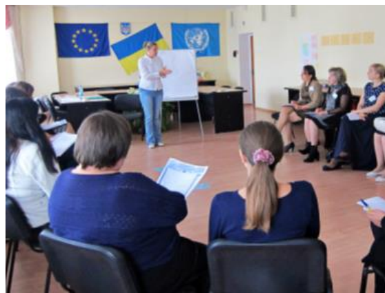
Тренінг з ненасильницького спілкування для спеціалістів соціальної сфери, м. Біла Церква