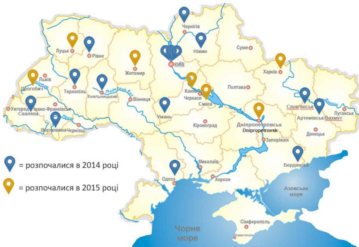
Карта молодіжних клубів, створених в рамках проєкту

Молодіжний клуб розглядається як місце, в якому діти та молоді люди можуть покращити життєві навички, розширити мережу соціальних контактів, підвищити обізнаність про соціальні права та отримати підтримку в їх реалізації.